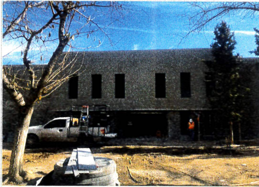
F1: Fachada principal